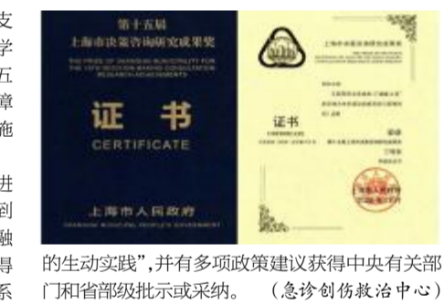
的生动实践”,并有多项政策建议获得中央有关部门和省部级批示或采纳。(急诊创伤救治中心)

医疗服务、健康促进保障、医防融合学科等四大支柱和组织管理体系重构、医防服务流程再造、多学科团队协作、一体化数据驱动、社会组织动员等五大创新机制,以及涵盖资源配置、服务提质、保障落实、人才学科、机制优化等多个维度的具体实施举措。 近年来,我院急诊创伤救治中心团队积极进取,在将 ISS \geq 16 的严重创伤救治成功率提升到 95%,达到国际先进水平的同时,积极开展医防融合研究,原创的“序贯医疗”体系,在全国范围获得推广应用,被新华社誉为“构建强大公共卫生体系